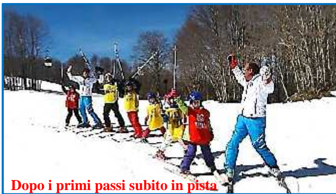
Dopo i primi passi subito in pista