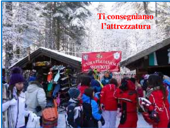
Ti consegniamo l'attrezzatura