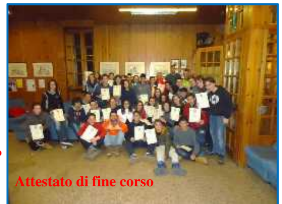
Attestato di fine corso