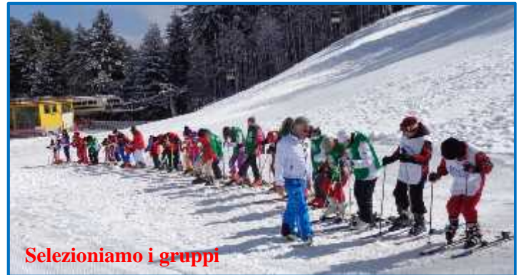
Selezioniamo i gruppi